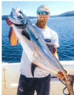
Das Durchschnittsgewicht liegt bei 12 Kilo

Vor der kroatischen Adria-Küste kommen immer mehr Große Gabelmakrelen vor. Die auch Palometa genannten Räuber werden vor allem im Sommer und Herbst vor