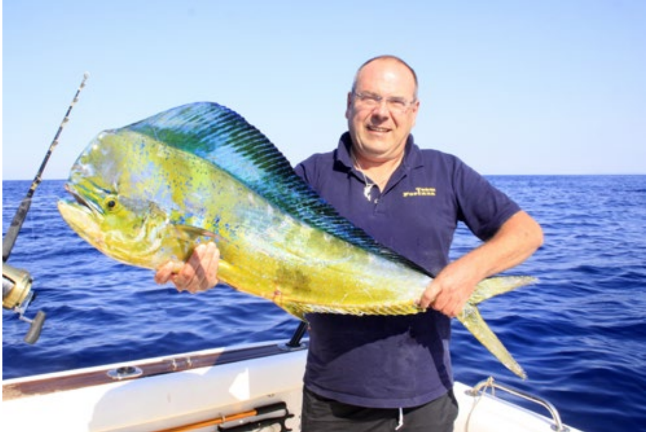
Goldmakrelen in teils stattlichen Größen sind im Sommer willkommener Beifang beim Thunfischangeln vor Kroatien.

Im Herbst können vor der Küste Istriens zwischen Pula und Rovinji Blauflossenthune in der Klasse von 100-200 kg gefangen werden. Selbst größere Exemplare gehen in dem dort flachen Wasser an den Haken: Skipper Marco